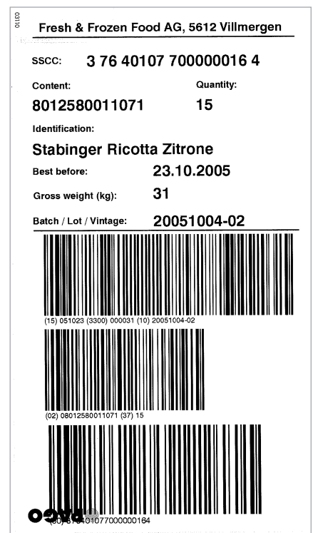
FFF-Etikette mit SSCC wird aus der ABACUS Auftragsbearbeitung automatisch generiert

In diesem Projekt hat sich auch gezeigt, wie einfach die Implementierung von E-Business sein kann, wenn die B2B-Standardlösung von ABACUS mit AbaNet verwendet werden kann und für das betreffende Unternehmen nicht eine Lösung individuell programmiert werden muss. Damit spart das Unternehmen bares Geld.